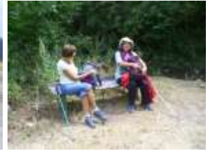
Врема нас је послужило тако да смо уживали у пешачењу