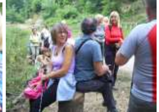
На путу ка Горњим Бањанима. Успут је Срба правио паузу да се сви фотографишемо у деблу, храста који и даље има зелено лишће иако је шупље стабло у средини