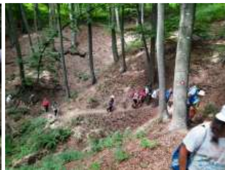
Група на пешачкој тури ка Чанку;, и одлазак са Чанка