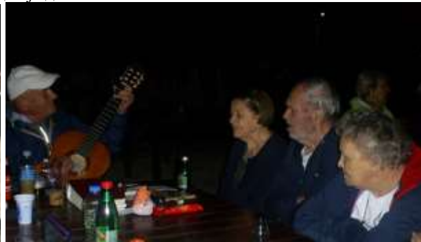
После томболе Мишко је свирао и певало се док киша није потерала унутра